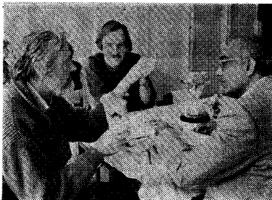
На «нейтронной школе» в Алуште.