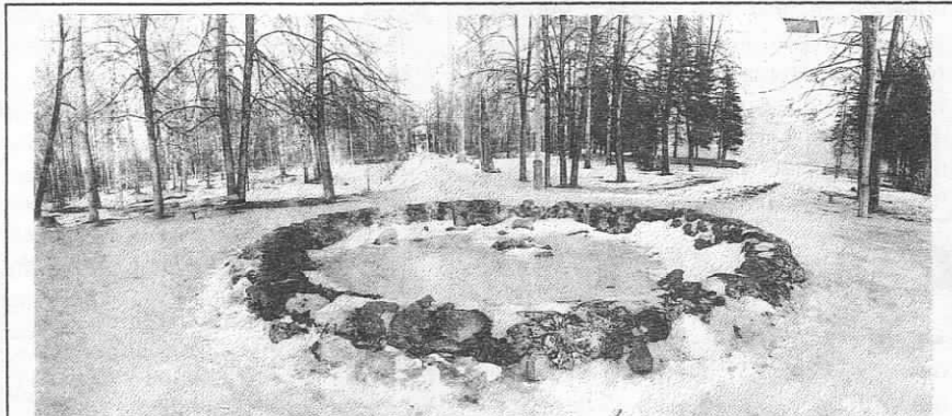
Дмитровская метеостанция сообщает, что 12 февраля – временами снег. Температура ночью -3 -8°, днем 0 -5°, ветер восточный, 7-12 м/сек., на дорогах гололедица. 13 февраля – небольшие осадки. Температура ночью -2 -7°, днем +2 -3°, ветер юго-восточный 4-9 м/сек., на дорогах гололедица. 14-15 февраля – преимущественно без осадков. Температура ночью -5 -10°, днем -5°.

НОВЫЙ арендатор появился недавно в библиотечном здании на ул. Блохинцева – позади главного входа гостеприимно открыта дверь филиала «Волжанки». По крайней мере, институтских любителей хорошего кофе это новшество должно обрадовать – кофе в зернах в «Волжанке» традиционно дешевле, чем даже на рыночных лотках.