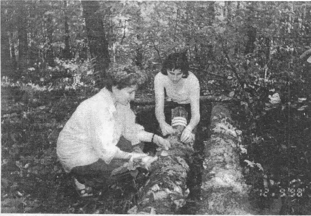
Чего только не содержат мхи в Тульской области!

только из России, но и из других стран, узнала русскую культуру. А решение экологических проблем всегда предполагает совместные, международные усилия. По крайней мере, в Европе – это всегда несколько стран. Даже имея деньги и хорошую науку в пределах одной страны, всех ее экологических проблем не решишь.