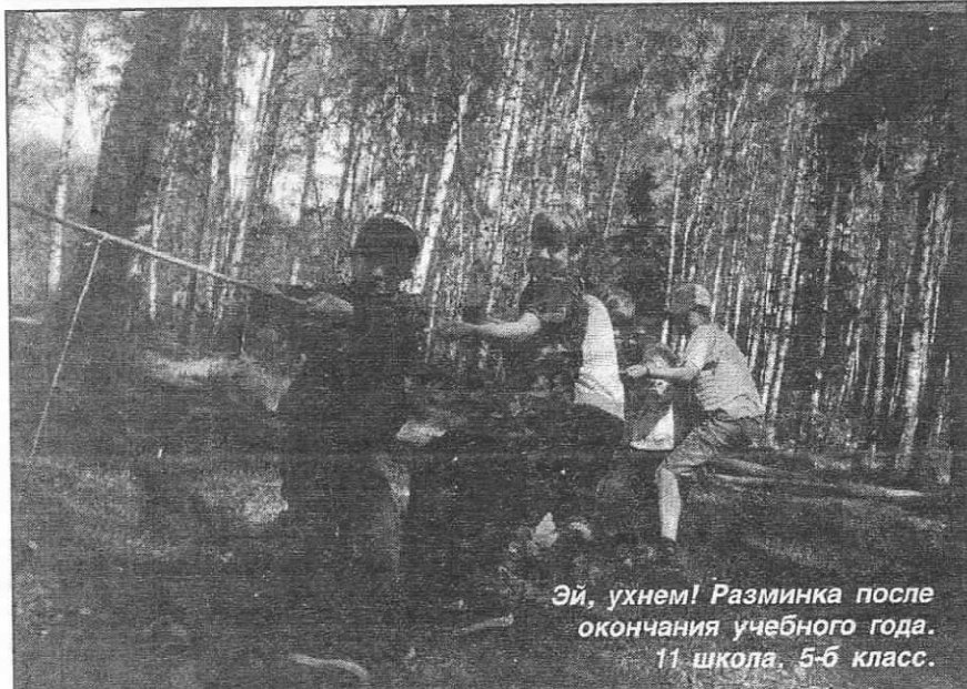
Эй, ухнем! Разминка после окончания учебного года. 11 школа, 5-6 класс.

вый предельный уровень платежей на оплату жилья и коммунальных услуг: на техническое содержание жилья 80 процентов от тарифа; на коммунальные услуги 47 процентов от тарифа. Доля предельно допустимых расходов семьи на оплату жилья и коммунальных услуг сохраняется в размере 19 процентов. Совокупный доход семьи, ниже которого предоставляются субсидии, составляет: для одиноких граждан – 764 рубля, для семьи из двух человек – 1260, для семьи из трех человек – 1755, для семьи из четырех человек – 2251, для семьи из пяти и более человек – 2747.