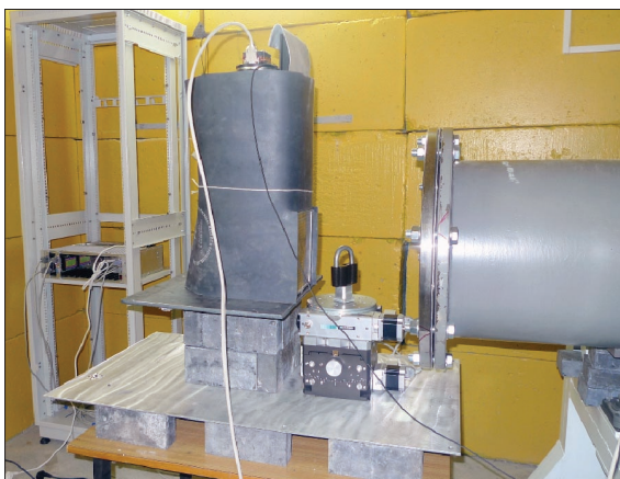
Общий вид установки для нейтронной радиографии и томографии (слева) и фотография детектора для регистрации нейтронных изображений (справа).

Составной вакуумированный коллиматор формирует выходной нейтронный пучок с размерами 20x20 см, что открывает широкие возможности для исследования достаточно крупных объектов в интересах различных областей науки и техники. Для регистрации нейтронов служит детектор на основе пластины сцинтиллятора, которая конвертирует нейтронное излучение в видимый свет. А уже оптическое изображение регистрируется высокочувствительной видеокамерой на основе CCD матрицы с размером одного пикселя 9 мкм. Минимальный размер неоднородности, который можно «увидеть» с помощью этого детектора, – около 0,2 мм, а время одного такого эксперимента не превышает 10 секунд. Для реконструкции трехмерной модели методом нейтронной томографии для вращения образца в нейтронном пучке служит система гониометров.