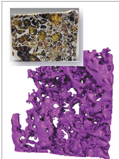
Восстановленная трехмерная модель распределения железоникелевого сплава в метеорите Сеймчан с помощью нейтронной томографии. Также представлена реальная фотография метеорита (справа).

Большие возможности открывают методы нейтронной радиографии и томографии в геофизических и астрофизических исследованиях. На рисунке представлена трехмерная модель распределения железоникелевого сплава в железокремнистом метеорите Сеймчан, обнаруженном в 1967 году. Нейтроны почти не поглощаются минералом оливином (желтые вкрапления), но зато сильно поглощаются железоникелевым сплавом. Нейтронная томография позволила восстановить объемный металлический «каркас» метеорита, не разрушая столь ценный объект исследования.