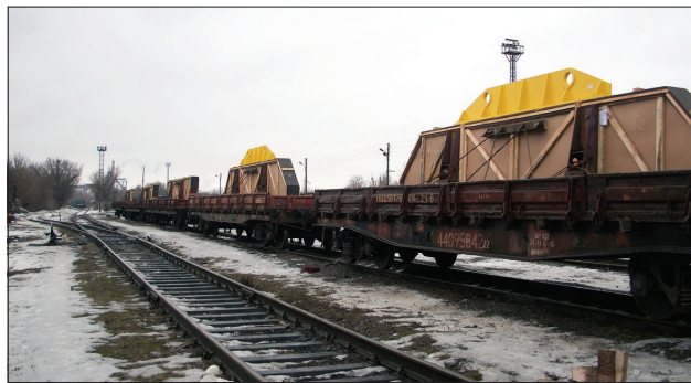
Пять платформ из Ново-Краматорска на Большой Волге с узлами магнита циклотрона.

– Полностью скомплектовать инженерное оборудование для фаб-