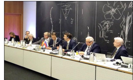
Берлин, 28 июня 2019 г. На заседании Смешанной российско-германской комиссии по научно-техническому сотрудничеству.

Уверен, примеры успешных российско-германских коллабораций, совместных проектов и мероприятий должны стать и стали благодаря Году видимыми для широкого круга наших сограждан и наших германских партнеров. Примеры сотрудничества должны дать импульс дальнейшему развитию российско-