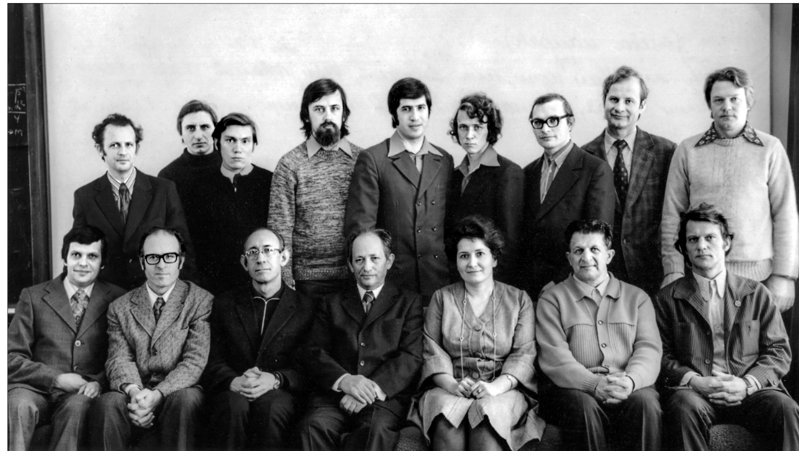
Встреча в Дубне выпускников Саратовского госуниверситета – сотрудников ОИЯИ с преподавателями физфака СГУ. 1977 г.